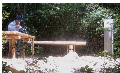
▲ 釈迦岳 (三等三角点)