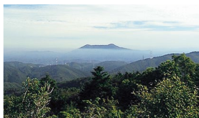
▲ ポンポン山から愛宕山を望む